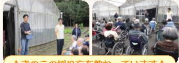
↑きのこの採り方を教わっています↑